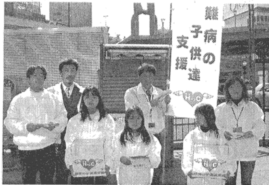
難病の子供達支援チャリティー活動を行った日本メディケーション協会の関係者(東京・上野で)

http://www.shinso.co.jp E-mail info@shinso.co.jp